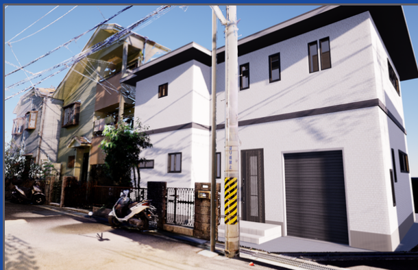
近隣状況の再現に点群を活用した 太陽光シミュレーションの実際の操作画面。