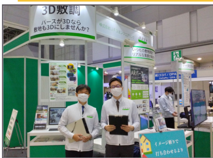
2023年12月13日(水)~15日(金) 東京ビッグサイト 建設DX展に出展決定！